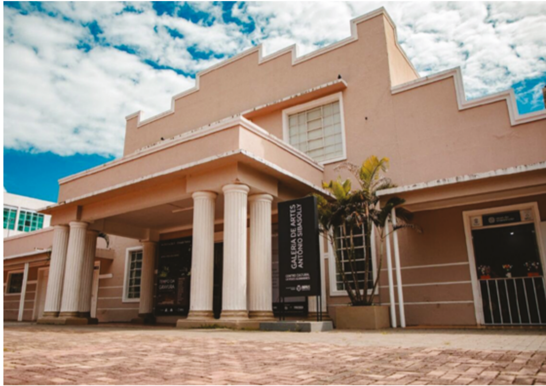
O ambiente está instalado na Galeria Antônio Sibasolly, no Centro, abriu suas portas no dia 26 de abril

ponsável pela idealização e execução do projeto, destacou a alegria em ver o sonho materializado. “O sonho não é só meu. Eu fui a pessoa que eles incumbiram de transformar em realidade, mas é um sonho de muitas pessoas. Eu trabalho muito com formação, com a perspectiva de inclusão e de acessibilidade de pessoas que realmente não conseguem ter acesso à cultura”, disse.