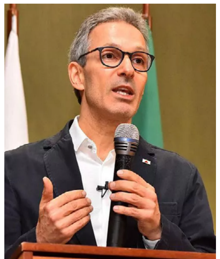
Romeu Zema: alternativa a direita para a disputa a presidente ou a vice-presidente

A confirmação ou não da candidatura de Zema como vice-presidente deve ser acompanhada de perto nos próximos meses, com grande interesse tanto por seus apoiadores quanto por seus adversários.