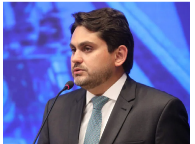
Juscelino Filho não pretende entrar cargo ao presidente

Nesta quarta, o ministro disse ao jornal O Globo que seguirá no cargo enquanto Lula quiser. "Cargo de ministro é de presidente. Até o dia que ele quiser eu vou cumprir a missão que ele me deu com muita honra, trabalhando pelo Brasil, fazendo o que eu estou fazendo com muita tranquilidade", afirmou.