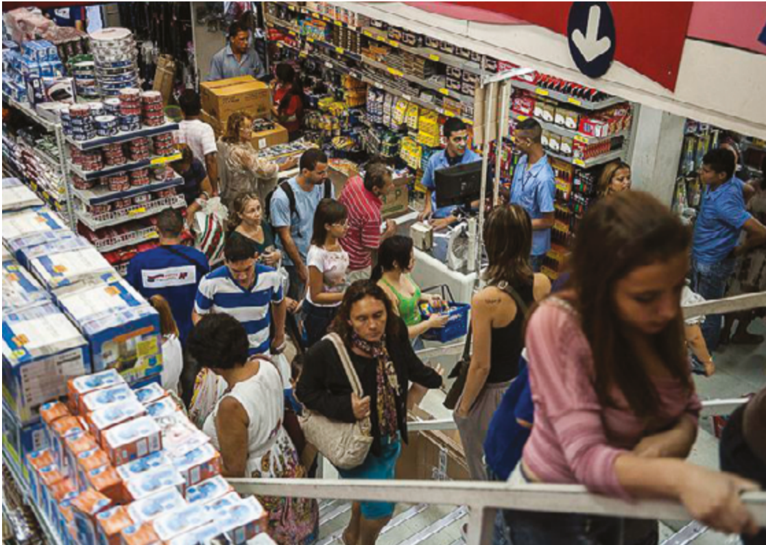
Índices são do Cempre, que reúne dados cadastrais e econômicas das empresas e organizações no país