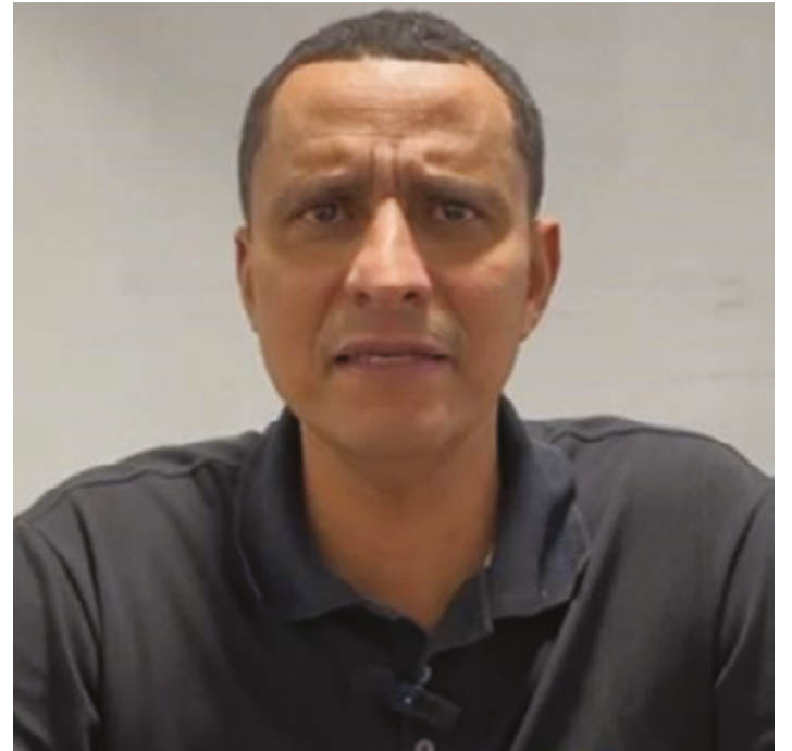
Sargento Pereira revela conversas com União Brasil e com o PSDB