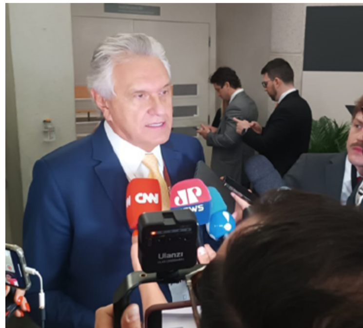
Ronaldo Caiado em Lisboa: defesa dos produtores goianos