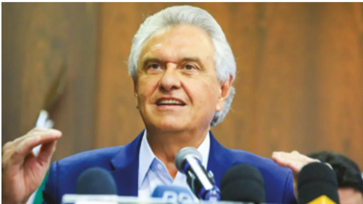
Ronaldo Caiado se posiciona como uma alternativa na eleição de 2026

Governador volta a se posicionar como pré-candidato à Presidência em 2026 e critica a falta de harmonia entre os Poderes