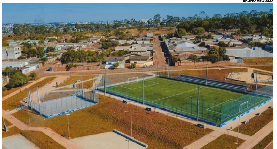
Estação, construída em área de 10,5 mil m², é o primeiro equipamento público de lazer edificado no bairro Santos Dumont

O programa permite parcerias entre a Prefeitura e a iniciativa privada para urbanização,