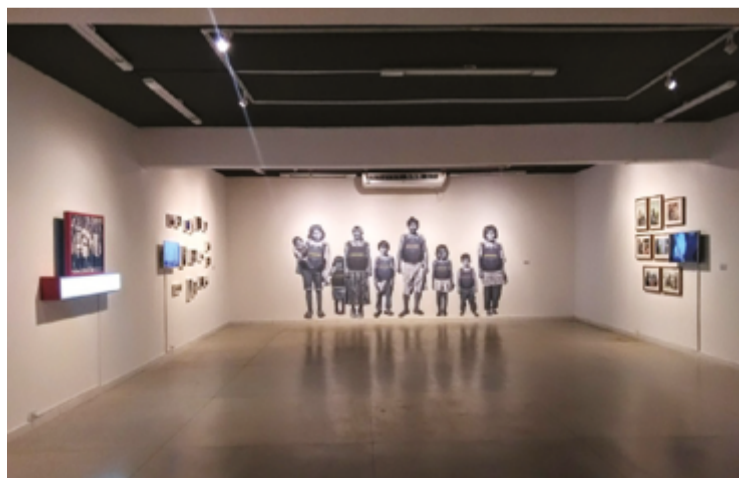
Para artistas goianos natos, naturalizados ou residentes há mais de 2 anos

Podem participar artistas goianos natos, naturalizados ou residentes em Goiás há mais de dois anos. Estrangeiros com visto de permanência definitiva há mais de três anos também são bem-vindos. Para se inscrever, os interessados devem acessar o site amigosdomapa.art.br e preencher a ficha de inscrição, anexan-