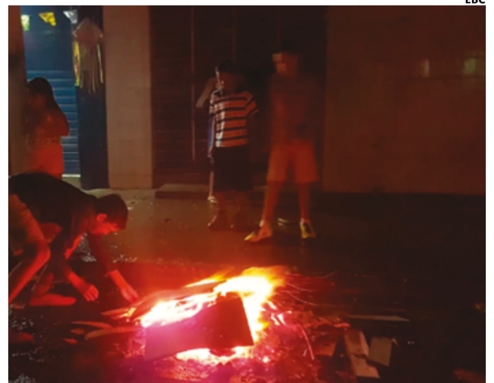
Fogueiras e os fogos de artifício geram problemas leves e graves