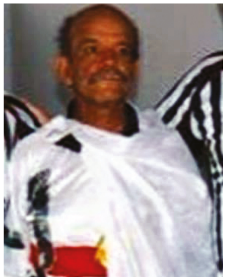
Estação do esporte número 16 vai reverenciar torcedor símbolo do Anápolis FC

A Estação do Esporte Sebastião Tavares fica em uma área de 4,8 mil metros quadrados e contou com investimentos de R$ 1,028 milhão. O espaço conta com estrutura adequada para integração, esporte e lazer, a fim de fomentar a convivência dos moradores do bairro e seu entorno. O projeto conta com calçada, estacionamento, áreas de convivência, playground, academia e campo de futebol society em grama sintética e com arquibancada.